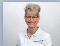
Stefanie Fritsch Kundencenter Athenslebener Weg 15

WÄRME BREITBAND STROM GAS PHOTOVOLTAIK E-MOBILITÄT